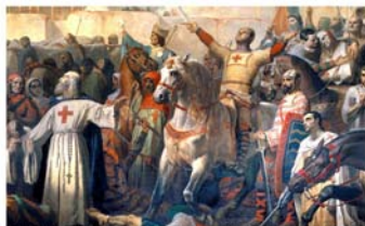
Prise de Jérusalem par les croisés le 15 juillet 1099 (première croisade), d'Enlè Digne, 1847

Organisées par Les Patrimoniales de la Vallée du Salembre en partenariat avec L'Agence culturelle Dordogne-Périgord